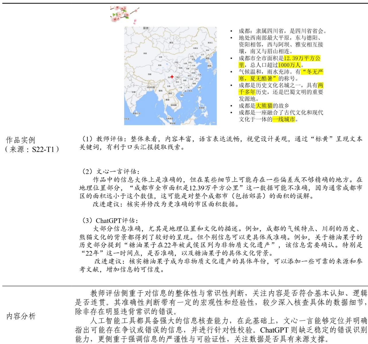
表 2. 信息准确度维度下教师与 AI 评估实例及特点描述