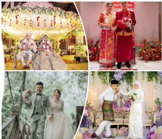
图1. 马来西亚婚俗

依据Kress与van Leeuwen(2020)视觉语法,图像模态的意义建构通过再现、互动、构图三大意义实现。