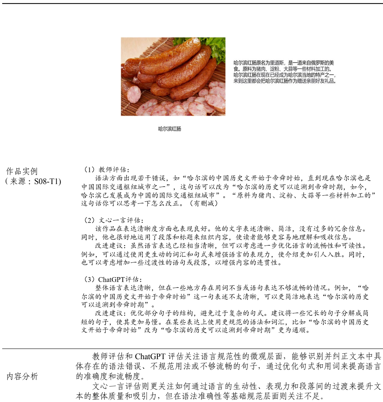
表 3. 语言表达清晰度维度下教师与 AI 评估实例及特点描述