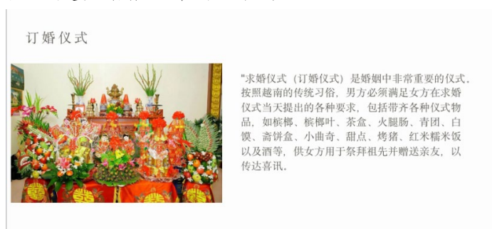
图2. 越南婚俗

从构图意义看,作品通过视觉焦点与信息层次传递意义。韩国留学生作品(图3)采用中心—边缘构图,将传统婚服作为视觉焦点置于画面中心,边缘辅以文字标注,通过尺寸与清晰度差异突出核心信息,构图设计合理,有效强化了文化符号的视觉权重。