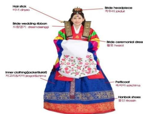
图3. 韩国新娘的传统婚服

从构图意义看,作品通过视觉焦点与信息层次传递意义。韩国留学生作品(图3)采用中心—边缘构图,将传统婚服作为视觉焦点置于画面中心,边缘辅以文字标注,通过尺寸与清晰度差异突出核心信息,构图设计合理,有效强化了文化符号的视觉权重。